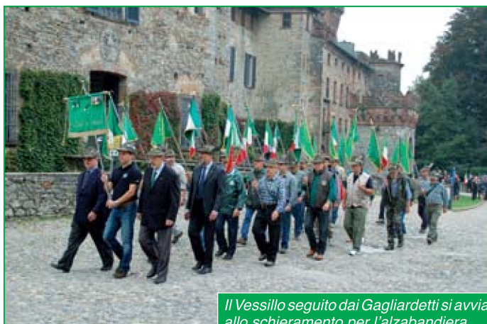
Il Vessillo seguito dai Gagliardetti si avvia allo schieramento per l'alzabandiera.

Il Gruppo Alpini di Somma Lombardo lo scorso 28 Settembre ha festeggiato il suo 80° anniversario di fondazione e per l'occasione ha organizzato una 3 giorni di manifestazioni per ricordare questo importante avvenimento.