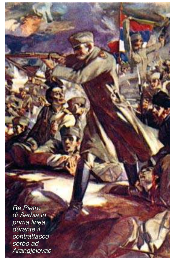
Re Pietro di Serbia in prima linea durante il contrattacco serbo ad Aranjelovac