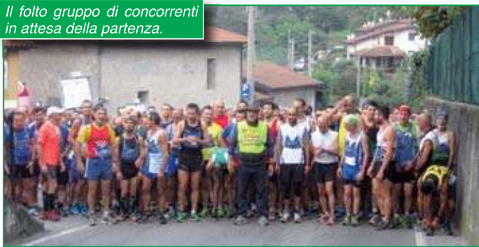
Il folto gruppo di concorrenti in attesa della partenza.

Nonostante le diverse concomitanze, la trentasettesima edizione della classica corsa podistica Alpina di Cardana, organizzata come sempre in maniera impeccabile dal locale gruppo, è riuscita a portare nel piccolo paesino più di quattrocento podisti, che si sono dati battaglia sull'impegnativo tracciato.