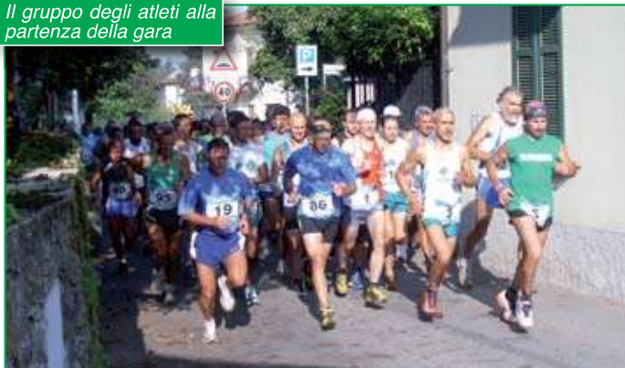
Il gruppo degli atleti alla partenza della gara

Appuntamento questo, con cadenza biennale, che ha visto ancora una volta il Comitato Organizzatore della Zona 7 impegnato con grande passione ed entusiasmo, ad organizzare una gara valida per il Trofeo del Presidente Nazionale della ns. Sezione; un appuntamento sportivo che ci permette, proprio attraverso questo grande impegno, di rinsaldare l'amicizia e di ricompattarci, laddove ce ne fosse bisogno; ... ce n'è sempre bisogno e quindi ben vengano queste manifestazioni.