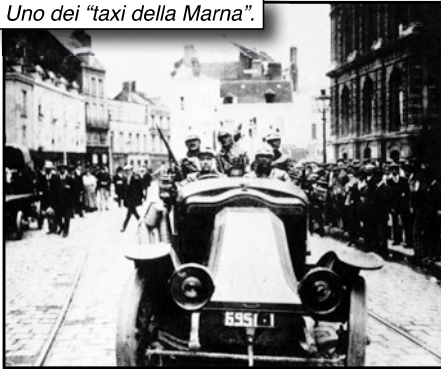
Uno dei "taxi della Marna".

Già in queste vicende, si nota un cambiamento rispetto alle strategie dei tempi passati, in quanto non ci sono più state guerre risolte in un solo scontro, ma azioni molto più statiche: la guerra di movimento, si trasformò in guerra di trincea, che durava mesi con attacchi e contrattacchi, morti e feriti, alla fine per pochi metri di terreno.