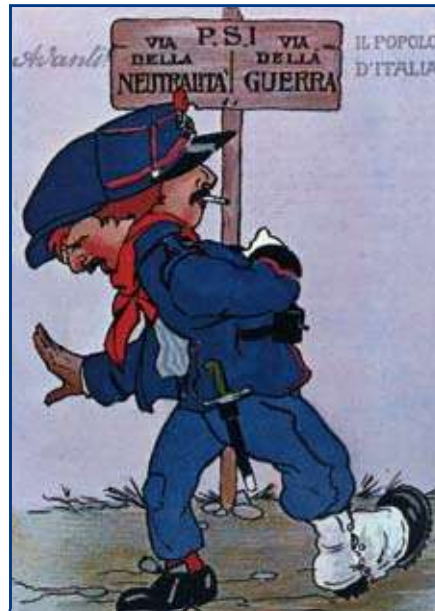
Il Partito Socialista di fronte alla guerra, combattuto tra interventismo e neutralismo.