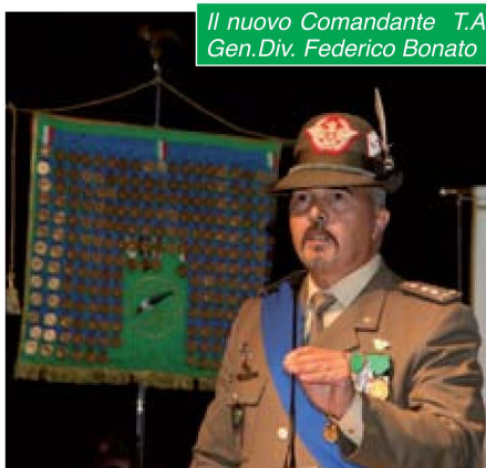
Il nuovo Comandante T.A. Gen.Div. Federico Bonato

grande determinazione e lungimiranza accettando tutte le sfide di questo momento storico particolarmente difficile che coinvolge non solo le Forze Armate ma l'intero Paese, sviluppando e portando a termine importanti processi finalizzati all'ottimizzazione delle risorse quali ad esempio la cessione alle Amministrazioni locali di aree demaniali non più in uso.