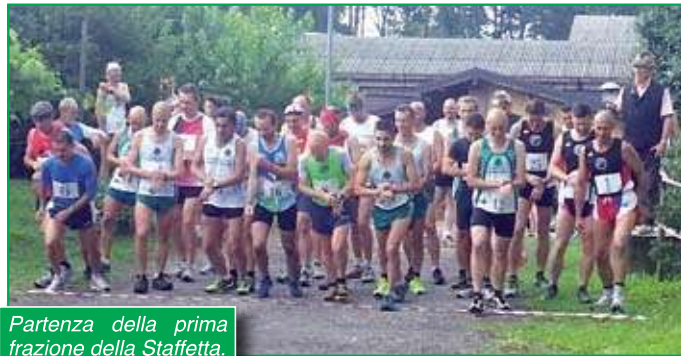
Partenza della prima frazione della Staffetta.

Terminate le pratiche relative alle iscrizioni, nel rispetto dei tempi previsti vengono chiamati alla partenza i primi frazionisti. Al via il numeroso gruppo con in testa i più astanti prende slancio. Il cambio con il secondo frazionista avverrà con tocco di mano nel punto dove è avvenuta la