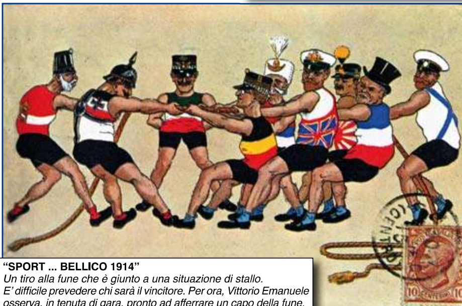
"SPORT ... BELLICO 1914"

Un tiro alla fune che è giunto a una situazione di stallo. E' difficile prevedere chi sarà il vincitore. Per ora, Vittorio Emanuele osserva, in tenuta di gara, pronto ad afferrare un capo della fune.