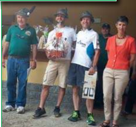
Premiazione della squadra del Gruppo di Capolago, Prima classificata