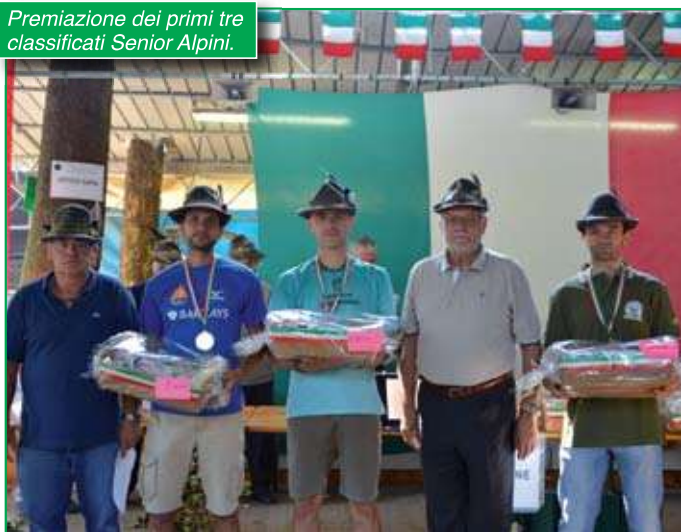
Premiazione dei primi tre classificati Senior Alpini.