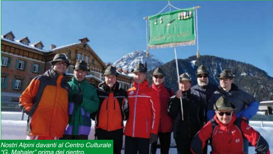
Nostri Alpini davanti al Centro Culturale "G. Mahaler" prima del rientro.

Week-end 23-24 Febbraio a Dobbiaco organizzati dalla sezione Alto Adige si sono svolti i Campionati Nazionali ANA di sci di Fondo in notturna.