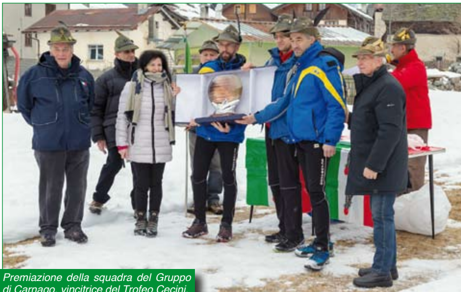
Premiazione della squadra del Gruppo di Carnago, vincitrice del Trofeo Cecini.

A tutti gli atleti è stata inoltre donata una calda