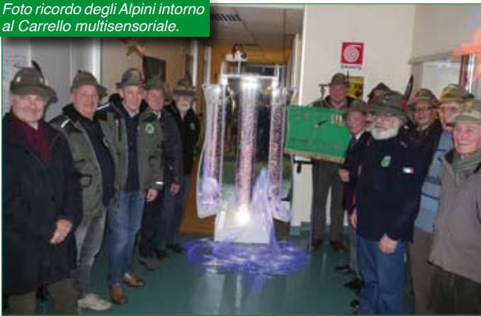
Foto ricordo degli Alpini intorno al Carrello multisensoriale.