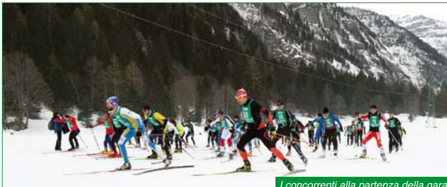
I concorrenti alla partenza della gara.

Come ogni anno il Gruppo di Vedano Olona organizza questa gara, la prima di quelle valevoli per l'assegnazione del Trofeo del Presidente Nazionale.