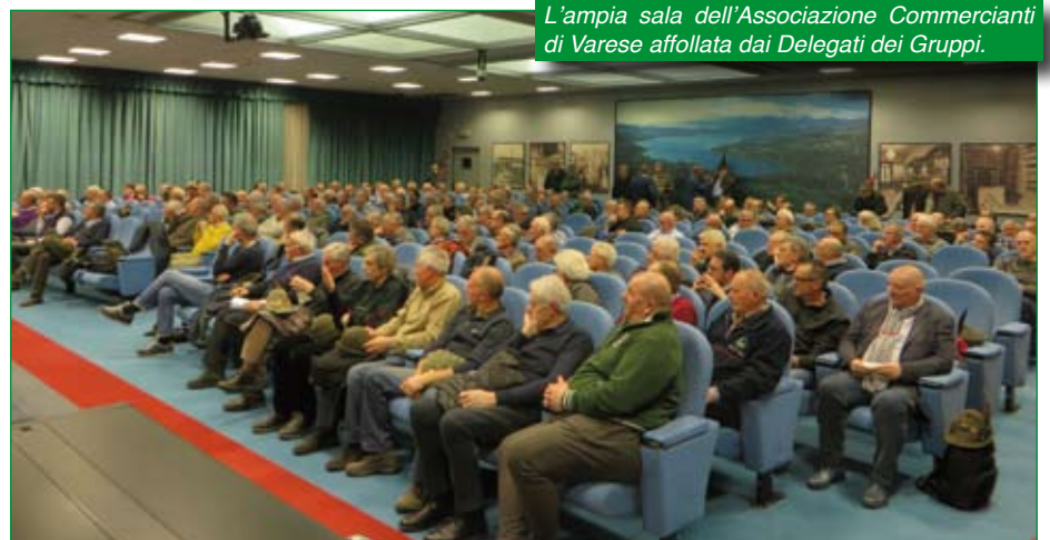
L'ampia sala dell'Associazione Commercianti di Varese affollata dai Delegati dei Gruppi.