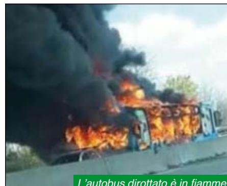
L'autobus dirottato è in fiamme.