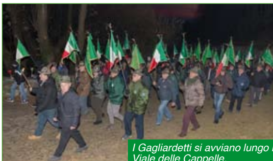
I Gagliardetti si avviano lungo il Viale delle Cappelle.

A Nikolajewka era sistemata a difesa e sbarramento una intera Divisione russa.