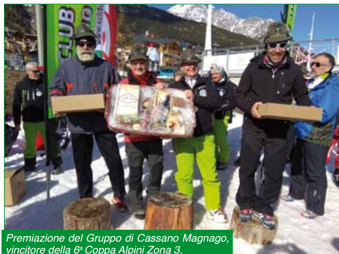
Premiazione del Gruppo di Cassano Magnago, vincitore della 6ª Coppa Alpini Zona 3.