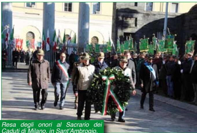
Resa degli onori al Sacrario dei Caduti di Milano, in Sant'Ambrogio.