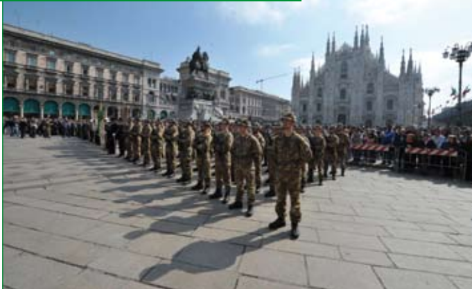
Venerdì 10 maggio, picchetto in armi schierato in Piazza Duomo per l'Alzabandiera.