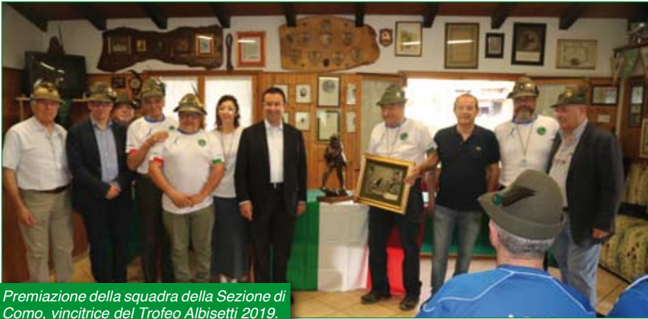
Premiazione della squadra della Sezione di Como, vincitrice del Trofeo Albisetti 2019.

Gara di Tiro a Segno con carabina - Poligono di Tiro di Varese 8-9 giugno 2019