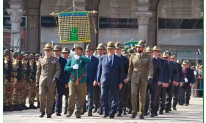
Venerdì 10 maggio, il Labaro dell'A.N.A giunge in Piazza Duomo per l'Alzabandiera.