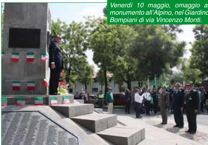
Venerdì 10 maggio, omaggio al monumento all'Alpino, nel Giardino Bompiani di via Vincenzo Monti.