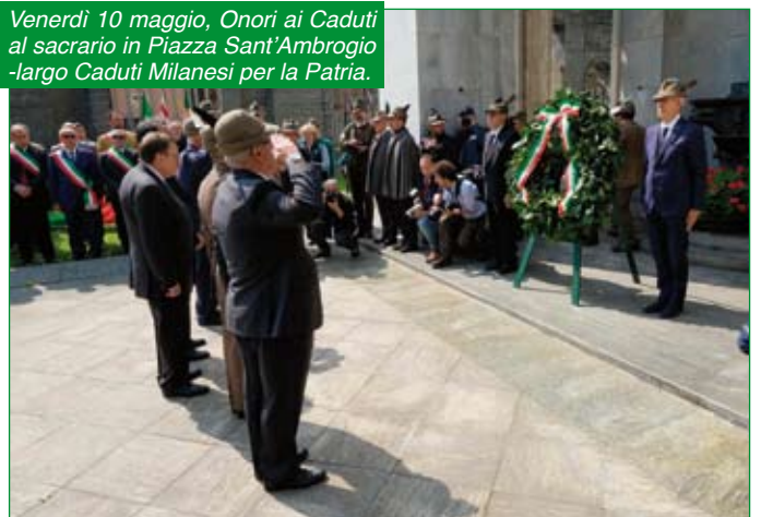
Venerdì 10 maggio, Onori ai Caduti al sacrario in Piazza Sant'Ambrogio -largo Caduti Milanesi per la Patria.