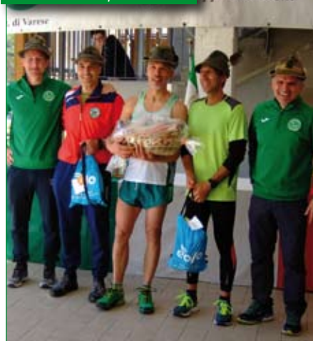
Premiazione Alpini Amatori.