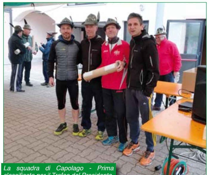
La squadra di Capolago - Prima classificata per il Trofeo del Presidente.