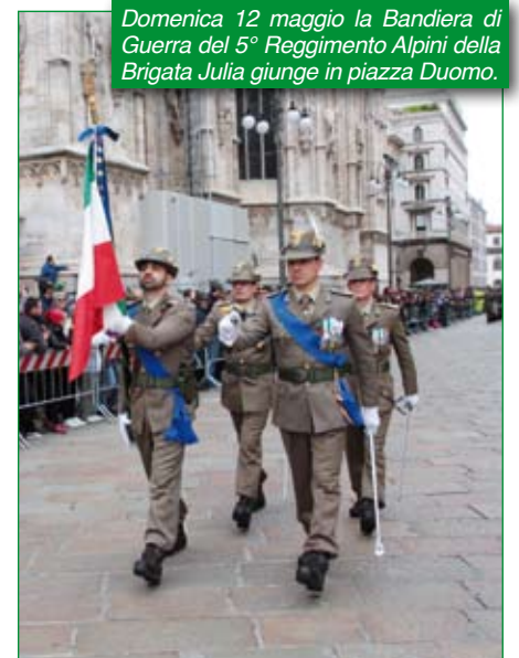
Domenica 12 maggio la Bandiera di Guerra del 5° Reggimento Alpini della Brigata Julia giunge in piazza Duomo.