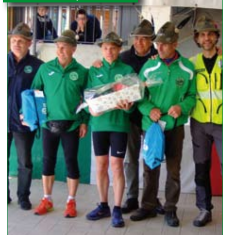
Premiazione Alpini Veci.