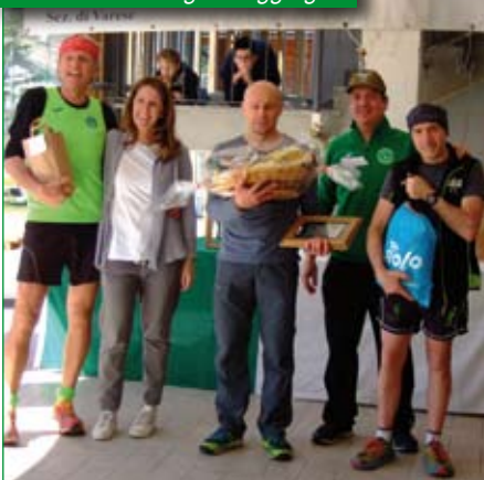
Premiazione categoria Aggregati.