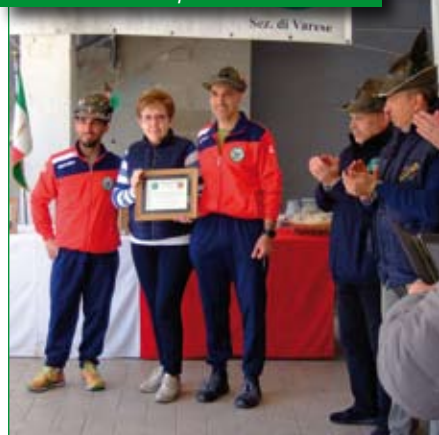
Premiazione 1ª squadra Trofeo Sessa.