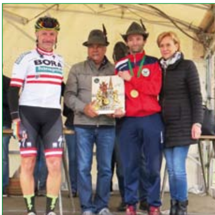
Premiazione della squadra vincitrice Carnago A con consegna del Trofeo Grandinetti 2019.