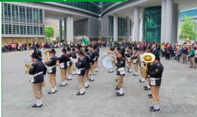
Sabato 11 maggio, Fanfara "La Baldoria" in concerto al Palazzo Regione Lombardia.