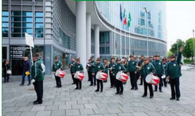
Sabato 11 maggio, Banda "Giuseppe Verdi" di Capolago al Palazzo Regione Lombardia.