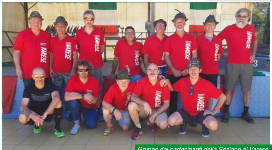
Gruppo dei partecipanti della Sezione di Varese.