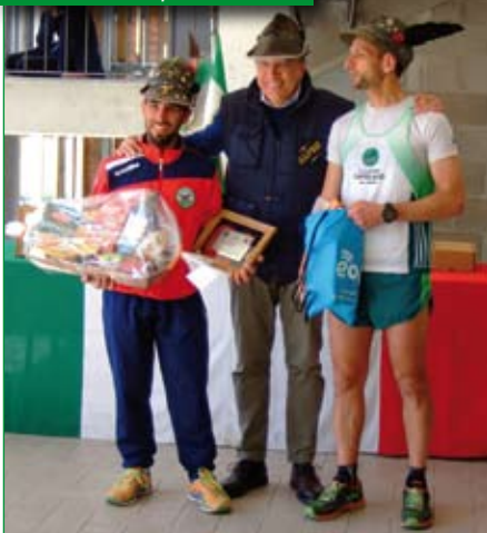
Premiazione Alpini Seniores.