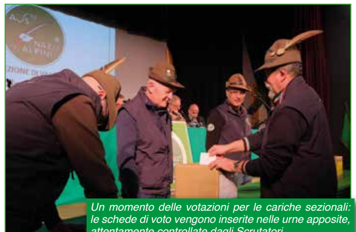
Un momento delle votazioni per le cariche sezionali: le schede di voto vengono inserite nelle urne apposite, attentamente controllate dagli Scrutatori.