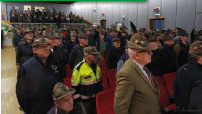
Il salone del Teatro "Eleonora Duse" di Besozzo durante gli Onori al Tricolore all'inizio dell'Assemblea dei Delegati 2025 della Sezione di Varese.