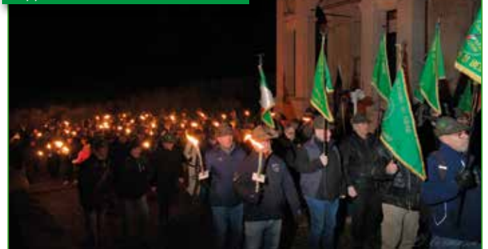
I Gagliardetti dei Gruppi e i numerosi Alpini con le fiaccole sfilano in pellegrinaggio dinanzi a una delle Cappelle del Sacro Monte di Varese.