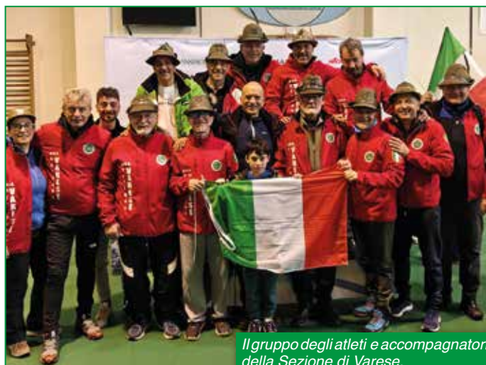
Il gruppo degli atleti e accompagnatori della Sezione di Varese.

Solo così la nostra Sezione potrà progredire non solo nei risultati ma anche in compattezza e unità di intenti. Arrivederci alla prossima edizione ancora più numerosi! LF