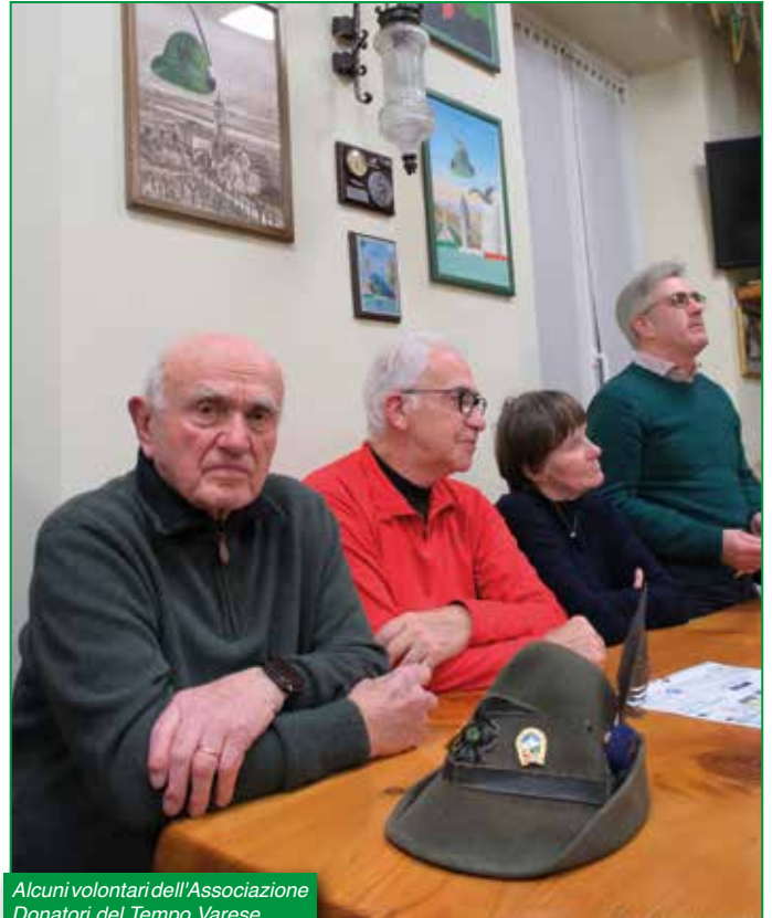
Alcuni volontari dell'Associazione Donatori del Tempo Varese.