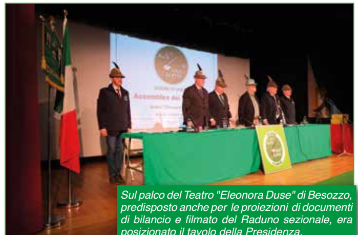
Sul palco del Teatro "Eleonora Duse" di Besozzo, predisposto anche per le proiezioni di documenti di bilancio e filmato del Raduno sezionale, era posizionato il tavolo della Presidenza.