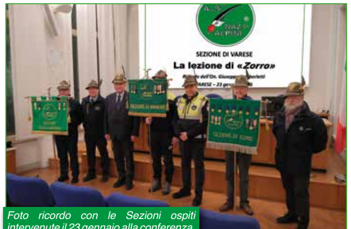
Foto ricordo con le Sezioni ospiti intervenute il 23 gennaio alla conferenza.