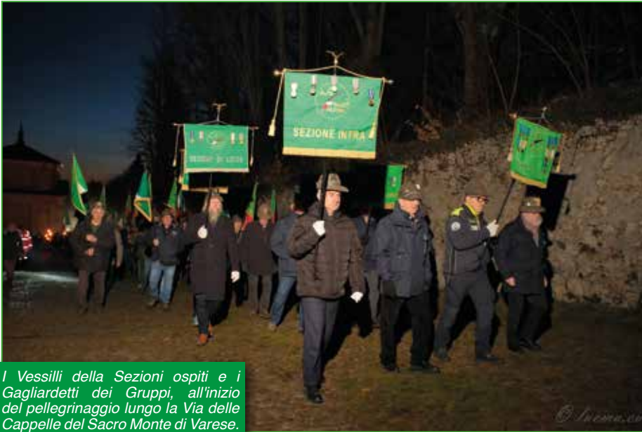
I Vessilli della Sezioni ospiti e i Gagliardetti dei Gruppi, all'inizio del pellegrinaggio lungo la Via delle Cappelle del Sacro Monte di Varese.