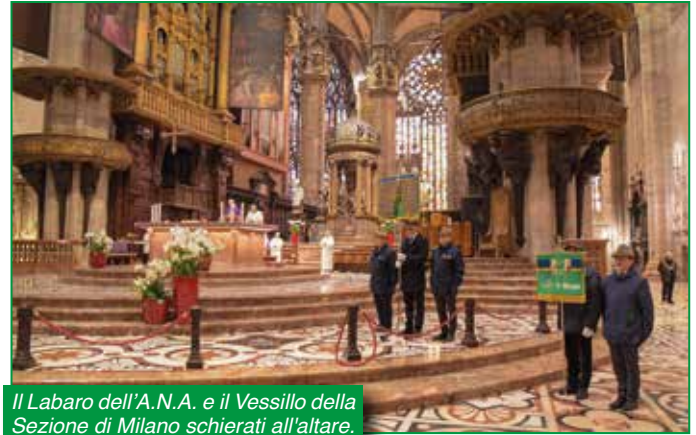
Il Labaro dell'A.N.A. e il Vessillo della Sezione di Milano schierati all'altare.