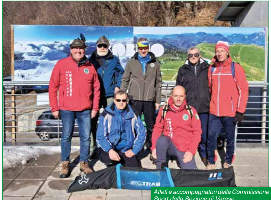
Atleti e accompagnatori della Commissione Sport della Sezione di Varese.

La nostra Sezione, presente con sei Alpini e un Aggregato, si è onorevolmente