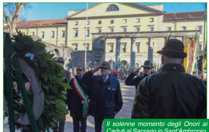
Il solenne momento degli Onori ai Caduti al Sacriario in Sant'Ambrogio.