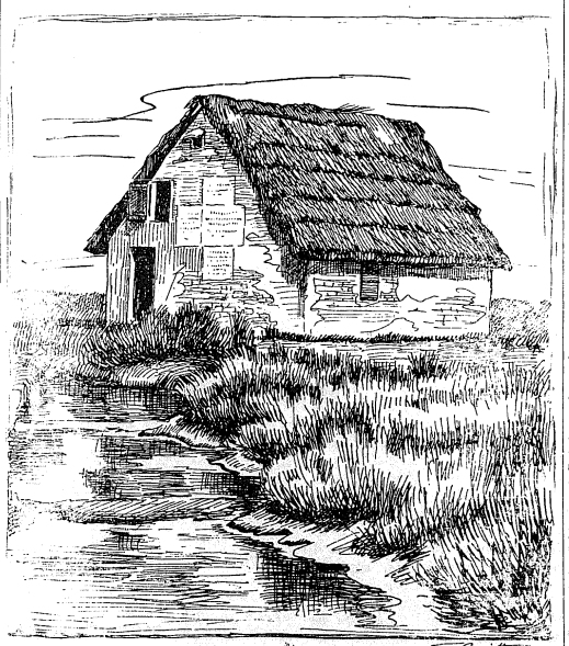
Il Capanno di Garibaldi nella Pineta di Ravenna.