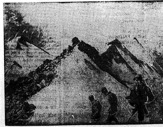
La Compagnia del Genio Pionieri «Orobica» al Mesule (Q. 3479)