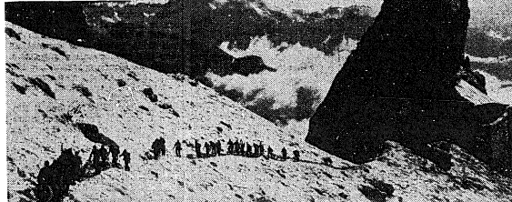
Un reparto dell'8° Alpini in ascensione verso la Cima Monfalconi