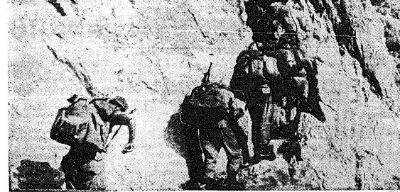
La 63ª Compagnia del Battaglione «Bassano» alla Tofana Seconda