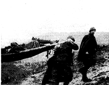
Gli eroismi e i sacrifici della Divisione Julia durante la Campagna di Guerra narrate per la prima volta da un comandante di battaglione.