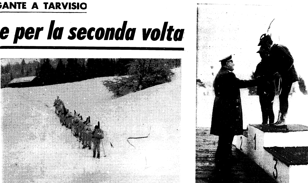
Una pattuglia militare in gara.

Gli altoparlanti hanno pure ricordato che su quella stessa pista dove stavano scendendo gli alpini in congedo avevano gareggiato nei giorni scorsi gli alpini alle armi e, al termine della gara sarebbero scesi in campo i giovani atleti dei centri di addestramento sciistico valtelliano. Quindi alpini di ieri, di oggi e di domani affiatati dalla passione per la montagna e dalla tradizione alpina.