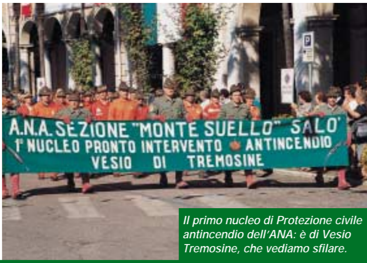
Il primo nucleo di Protezione civile antincendio dell'ANA: è di Vesio Tremosine, che vediamo sfilare.