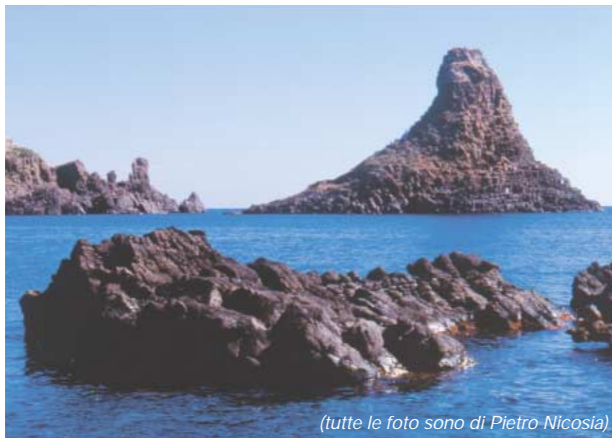
Lo splendido angolo marino dei faraglioni di Acitrezza.

ché in due ore si può percorrere l'autostrada Catania-Palermo e passare tra campagne ben coltivate, e ammirare la rocca di Enna, il capoluogo più alto d'Italia, e maga-