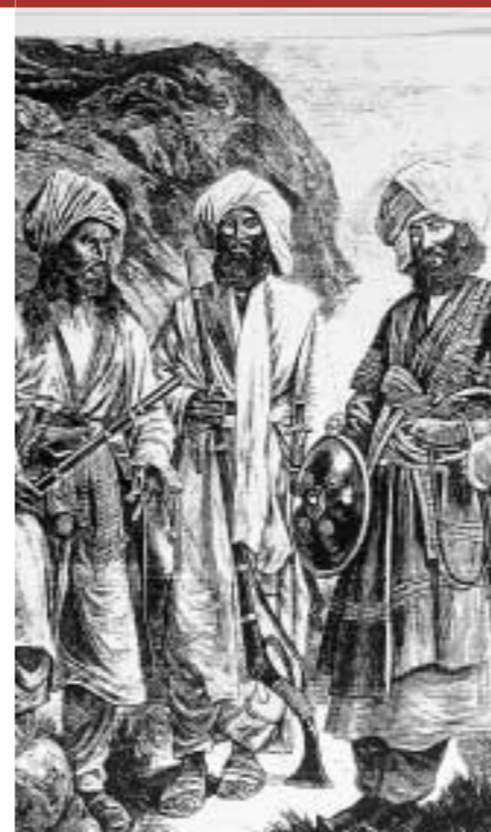
A sinistra: fucili a pietra focaia, ora preziosi pezzi da museo, usati dalle truppe da montagna afgane durante l'occupazione inglese del XIX secolo.