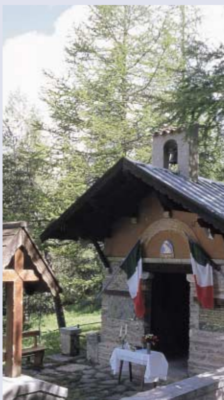
Chiesetta dedicata alla Madonna della neve in ricordo dei Caduti del fronte occidentale

Penna", al Canalone di Roche-molles dove, nel 1931, una valanga uccise 21 alpini del battaglione "Fenestrelle" in esercitazione... E si potrebbe continuare a lungo.