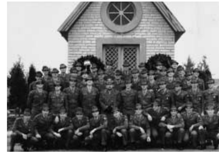
ARTIGLIERI DEL 6°, ANNI '65/66