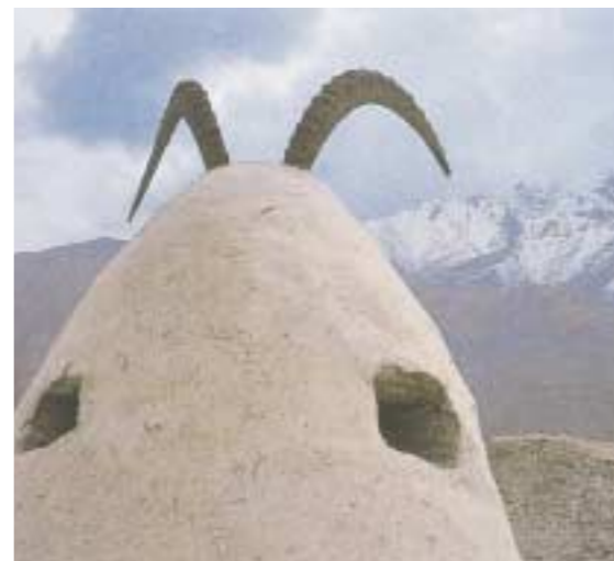
Corna di stambecco ornano le tombe dei pastori del nord.

Anche per Marco Polo è il luogo più alto del mondo, dove "l'aere è così puro che gli uomini che si sentono assaltare dalla febbre vi stanno dui o tre