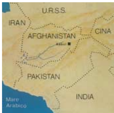
Afghanistan, crocevia dell'Asia. A oriente di Kabul il "becco d'anatra", che chiude alla Russia la via del mare.

Alessandro Magno e Marco Polo, Buddha e Maometto, mongoli, inglesi, russi e americani. E anche italiani, alpini compresi