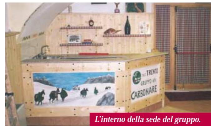
L'interno della sede del gruppo.