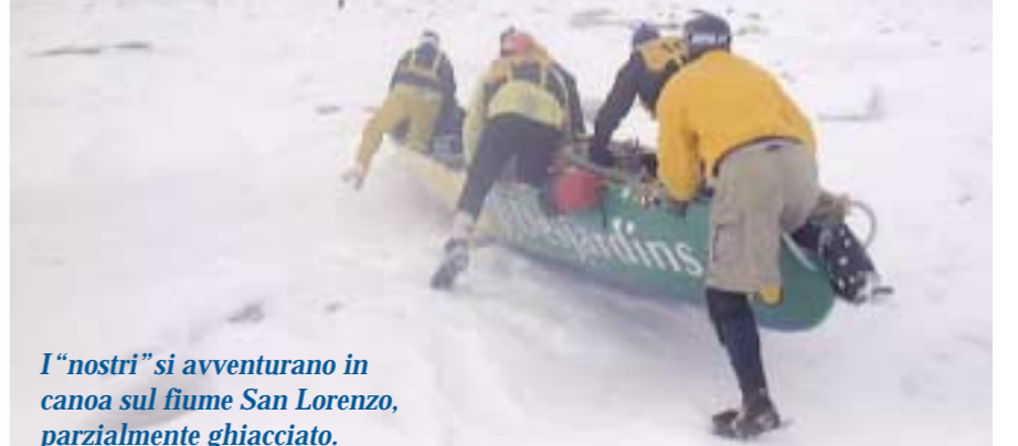
I "nostri" si avventurano in canoa sul fiume San Lorenzo, parzialmente ghiacciato.

Partenza da Quebec, la bella città sull'estuario del San Lorenzo dominata dalla cittadella cinta di mura. Francese fin dalla fondazione, Quebec fu al