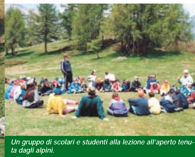
Un gruppo di scolari e studenti alla lezione all'aperto tenuta dagli alpini.

In quest'opera di educazione civile gli alpini della sezione di Salò sono impegnati da anni. Grazie al contributo di soci con esperienza di insegnamento, hanno messo a punto un ciclo di conferenze adatto alle scuole elementari e medie, durante le quali, con proiezione di diapositive, vengono spiegate le caratteristiche →