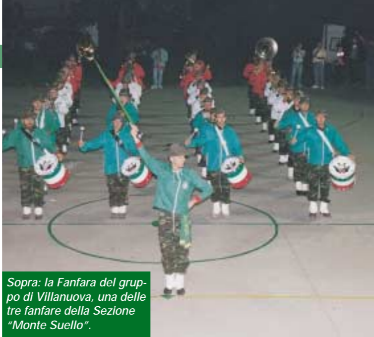
Sopra: la Fanfara del gruppo di Villanuova, una delle tre fanfare della Sezione "Monte Suello".