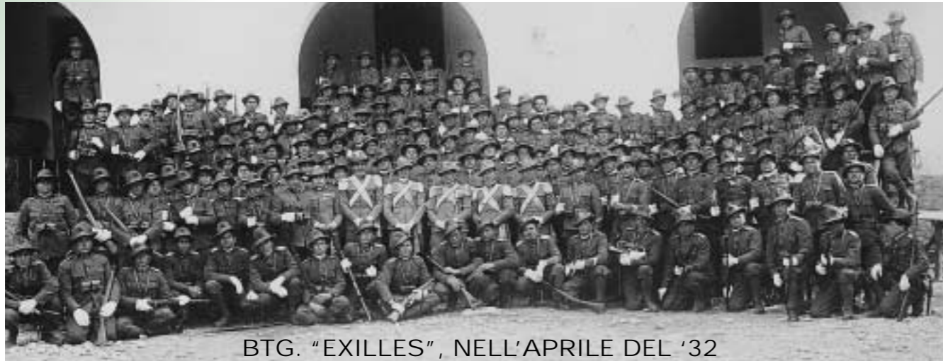
BTG. "EXILLES", NELL'APRILE DEL '32

Chi si riconosce? Incontriamoci • Chi si riconosce? Incontriamoci • Chi si riconosce? Incontriamoci • Chi si riconosce? Incontriamoci • Chi si riconosce? Incontriamoci