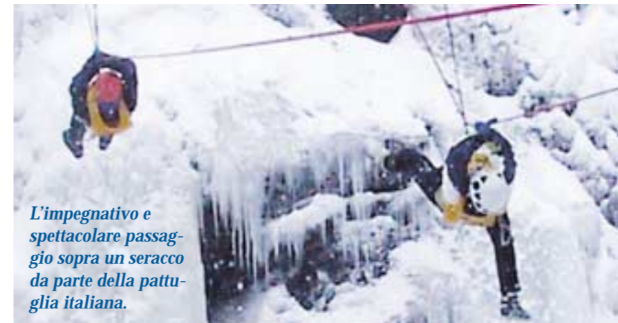
L'impegnativo e spettacolare passaggio sopra un seracco da parte della pattuglia italiana.