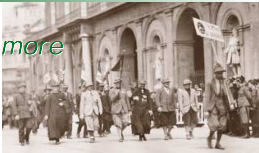
Due foto storiche: 16-18 aprile 1932: gli alpini della "Sezione del Benaco" all'Adunata nazionale di Napoli.

Salò era già stata sede di una compagnia del battaglione Rocca d'Anfo all'inizio del secolo e di un distaccamento del battaglione. La cittadina di Salò, inoltre, si trova in posizione quasi baricentrica rispetto all'intero territorio.