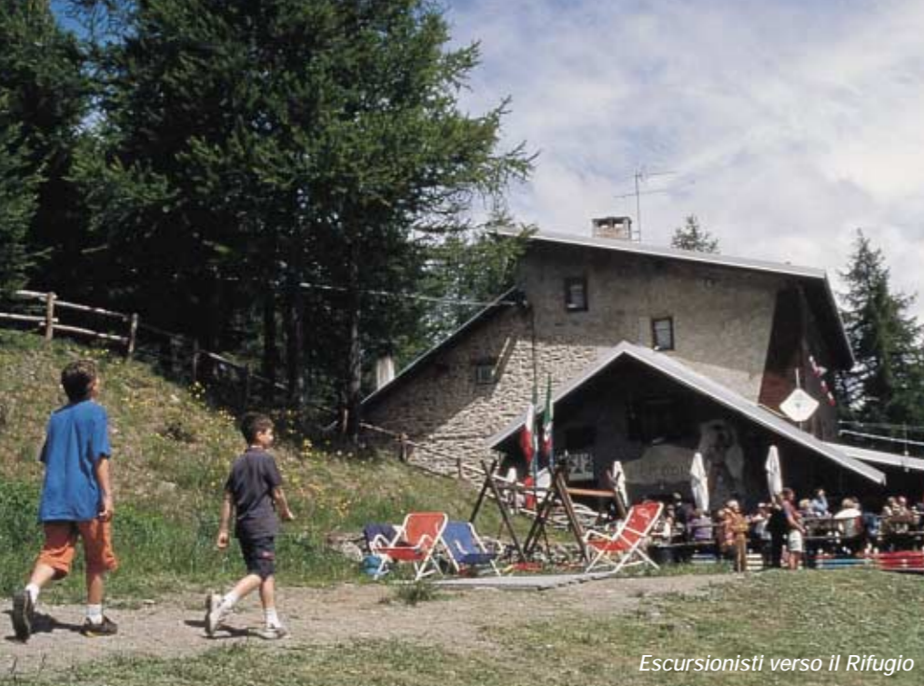
Escursionisti verso il Rifugio

La Valle di Susa è ormai in pieno fermento, in vista dei Giochi Olimpici Invernali del 2006.