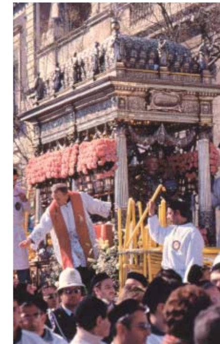
Tra folklore e religiosità: la processione di Sant'Agata.

In vista della prossima adunata a Catania le penne nere siciliane hanno messo in rete il sito della sezione ( www.anasicilia.com ). Contiene informazioni sull'organigramma sezionale, le notizie storiche della sezione, le informazioni sulla protezione civile e, ovviamente, sull'adunata, il tutto ...allietato dai testi delle tradizionali canzoni alpine.