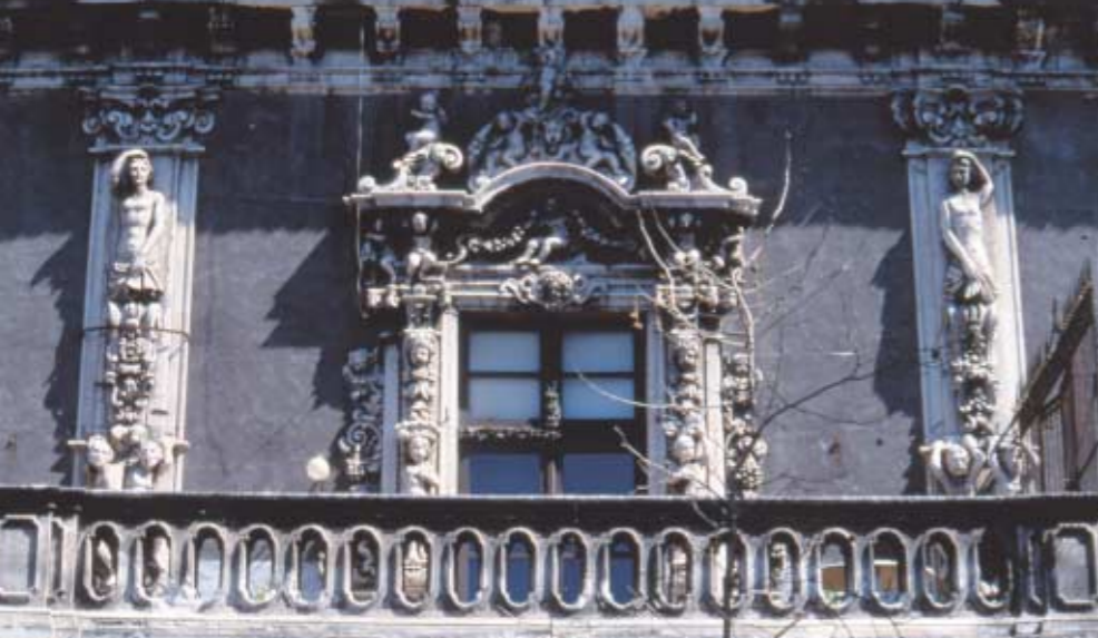
Uno scorcio di Palazzo Biscari: esempio di magnificenza architettonica che ritroveremo anche in tanti altri palazzi storici della città.

→ un silenzio magico da sembrare fuori dal mondo. Sulla spiaggia di Capo Passero affittano pedalò con cui si può andare a fare il bagno nel vicino scoglio dove c'è una vecchia fortezza aragonese e dove una volta sino a pochissimi anni addietro c'era la più vecchia tonnara del mondo. Pensate che ai tempi dei coloni greci i pescatori si mettevano sulla punta dello scoglio e infilzavano i tonni con delle lunghe aste. Poi le loro donne prendevano i tonni, li tagliavano su dei «piatti» ricavati sugli stessi scogli, tritavano il pesce, ci mettevano delle spezie e facevano il «garum», piatto prelibatissimo che poi per nave finiva sulle tavole dei ricchi romani.