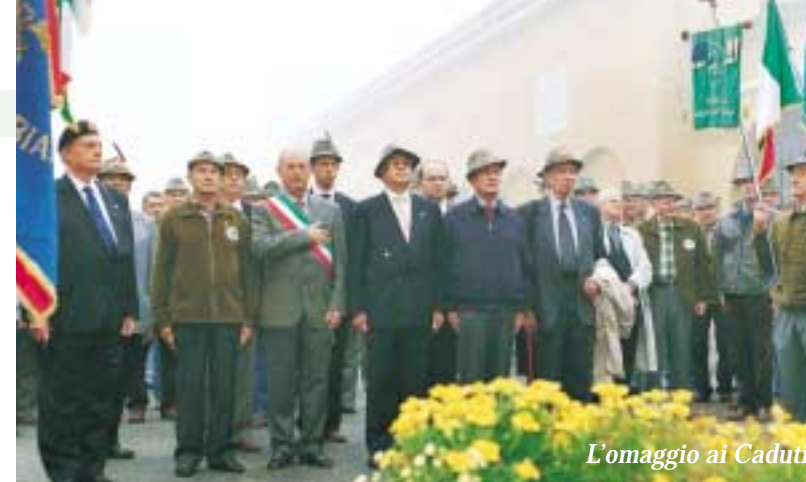
L'omaggio ai Caduti.