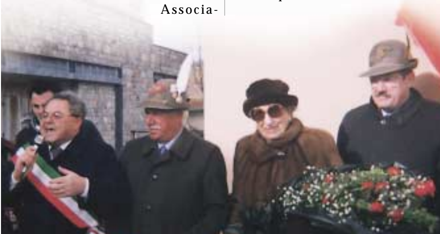
Il sindaco di Bella, Cataldo Sabato, durante la cerimonia di ringraziamento, affiancato dal generale Antonio Cassotta, dalla signora Periz ed uno dei figli.

I binomio alpini-terremoto prende corpo nel 1976 in Friuli. Ho sempre davanti