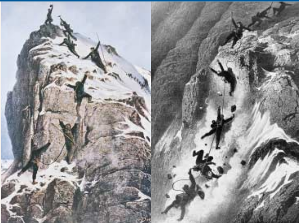
Dal trionfo alla tragedia: è passata appena un'ora.

Raggiungono una piazzola a 3450 metri, rimandano indietro il più giovane dei Taugwalder, bivaccano e ripartono il mattino successivo sotto un cielo limpidissimo (sul versante opposto Carrel attaccherà...due ore dopo). L'ascensione prosegue senza eccessive difficoltà, salvo alcune incertezze del giovane