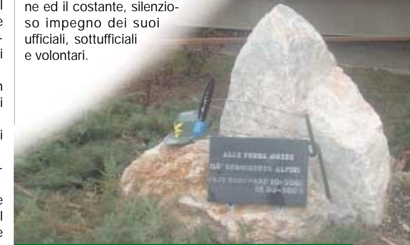
Il monumento alle Penne Mozze costruito dagli alpini del 9° in Kosovo.

Questo ed altro ha fatto il 9° reggimento alpini in Kosovo, con la tradizionale di totale dedizione ed il costante, silenzioso impegno dei suoi ufficiali, sottufficiali e volontari.