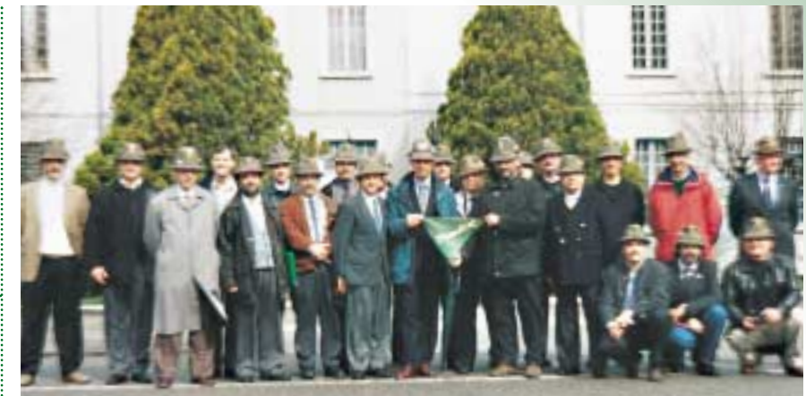
Un gruppo di sottotenenti, del 79° corso AUC del 1975, alla Scuola militare alpina di Aosta. Si sono riuniti nella loro caserma con il loro capitano di allora, l'attuale generale Roberto Stella. Hanno partecipato all'alzabandiera, come allora, poi la giornata è trascorsa tra ricordi e allegria. Si sono lasciati con la promessa di ritrovarsi per il 30° anniversario del Corso.