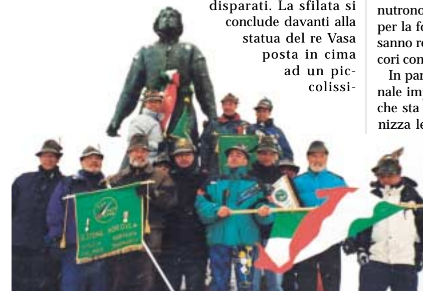
Un momento entrato ormai nella tradizione: gli alpini attorno alla statua di re Vasa, in onore del quale si corre la mitica Vasaloppet.

disparati. La sfilata si conclude davanti alla statua del re Vasa posta in cima ad un piccolissimo