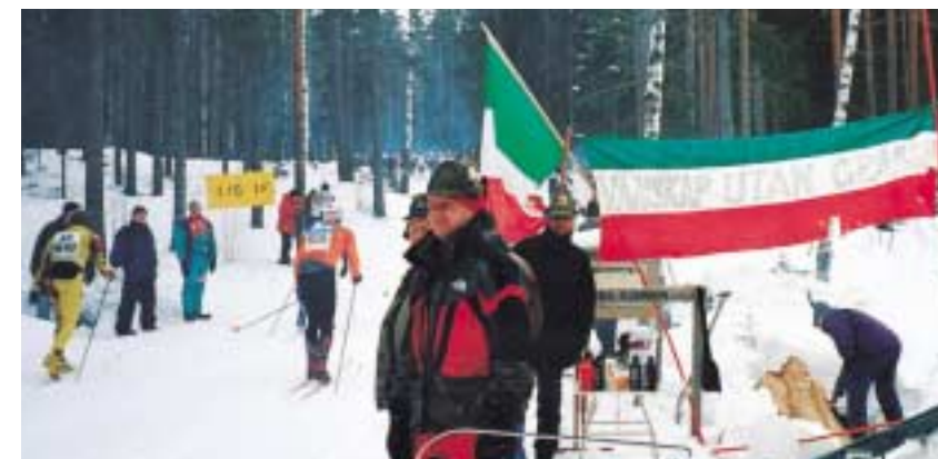
Il posto di ristoro allestito dagli alpini della Nordica: un angolo d'Italia lungo la pista tra i boschi.

La sfilata per le strade di Mora, aperta dalla bandiera svedese, dal Tricolore e i vessilli.