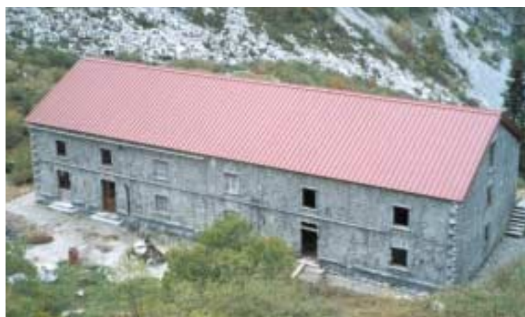
Nelle foto: l'ex ospedale, prima e dopo il ripristino da parte degli alpini.

Una nota della redazione de L'Alpino è d'obbligo: a fine settembre '99 le squadre di Camminaitalia, durante la 182ª tappa dal Passo Tanamea a Prossenico, transitarono dall'ex-ospedale, trovandolo in condizioni di grave degrado. Nessuno avrebbe immaginato che meno di due anni dopo la tenacia di un gruppetto di alpini lo avrebbe restituito al godimento degli alpinisti.