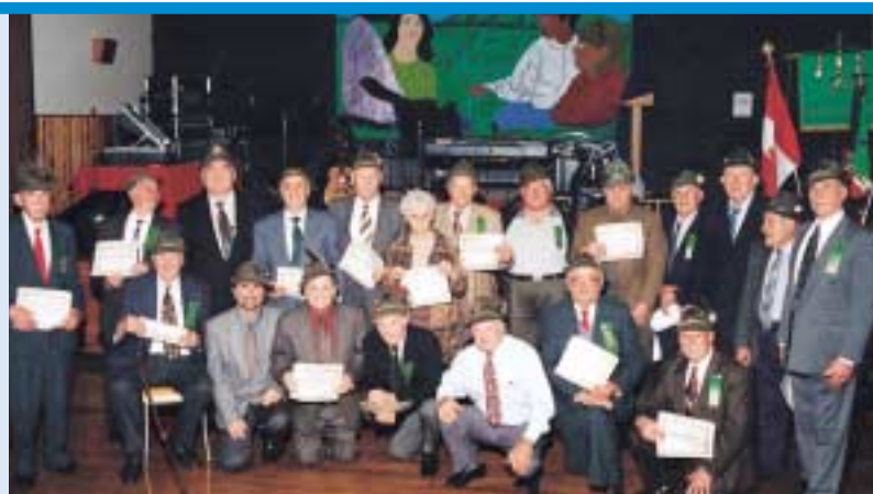
I reduci e gli ex presidenti della sezione di Vancouver con il certificato di benemerita dell'intersezionale.

Le celebrazioni si sono aperte al Centro Culturale Italiano, in piazza Giovanni Caboto, dove è stata deposta una corona al monumento ai Caduti. Quindi le penne nere hanno raggiunto una sala della chiesa di Sant'Elena dove sono