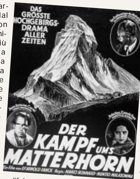
Manifesto per il film del 1928 "Lotta per il Cervino". Un Whymper raffinato milord, un Carrel con dopobarba, una madame Carrel tipo "In montagna sarò tua" (già con 5 figli a carico: ne arriveranno altri 6).

Lassù, Whymper e Carrel, ormai rappacificati per sempre, si saranno guardati perplesși.