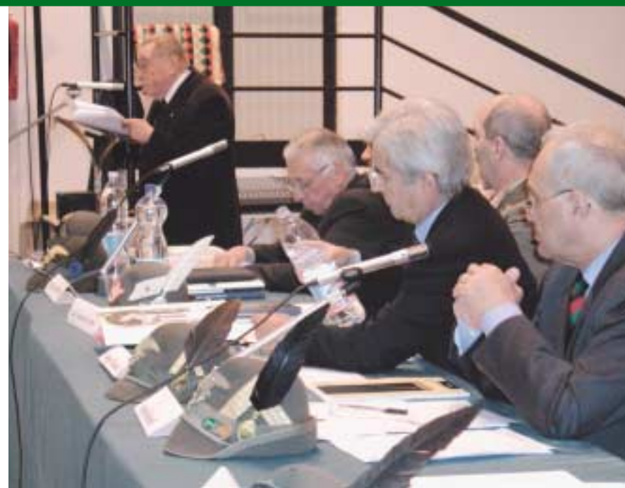
L'intervento di un delegato al tavolo della presidenza.