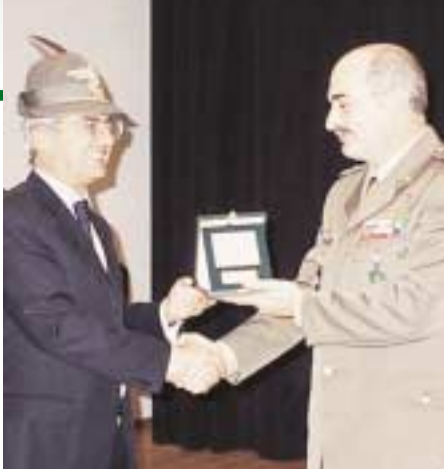
Il presidente nazionale Beppe Parazzini consegna il crest dell'ANA al capo di Stato Maggiore delle Truppe alpine, brigadiere generale Vincenzo Cardo.

Su questo fenomeno ha preso ancora la parola il generale Cardo, che lo ha definito "inevitabile e quindi non in discussione". Ed ha comunicato che lo Stato Maggiore ha accettato il progetto del Comando Truppe alpine di istituire in val Pusteria, a San Candido-Dobbiaco, un ente addestrativo che di fatto è il 6° reggimento alpini, che avrà una forza intorno alle 600 unità ed avrà il compito di "alpinizzare" le Truppe alpine. Sono stati creati due poli di specializzazione: uno d'élite, che è e rimane la ex SMALP, cioè il Centro addestramento alpino, destinato a qualificare gli istruttori; il centro di Dobbiaco-San Candido ha il compito di recuperare le professionalità e le esperienze del 6° Alpini e garantirà l'alpinità a livello di reparto. "In prospettiva - ha concluso l'ufficiale - in val Pusteria qualificheremo gli alpini e i reparti fino al livello di battaglione. Questo costituisce una risposta al quesito che ci ponevamo, e cioè