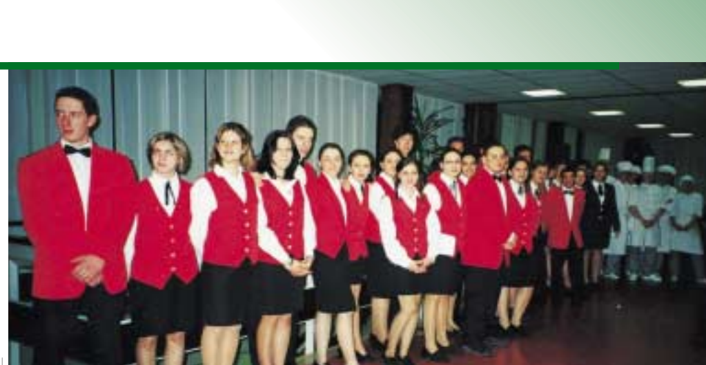
Gli allievi dell’istituto alberghiero di Recoaro Terme.