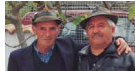
Dopo 51 anni sono stati di nuovo insieme, ritrovandosi al raduno del loro gruppo dell'8° reggimento Alpini di Tarvisio svolto a Torre dei Nolfi (L'Aquila).