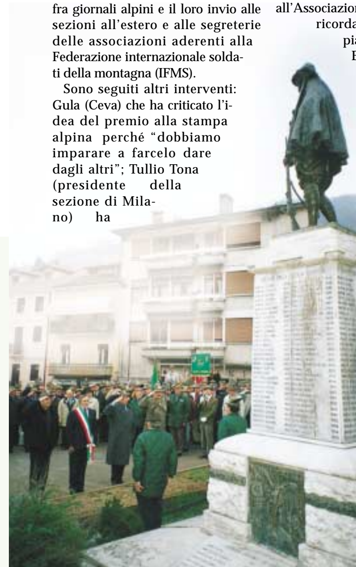
La deposizione della corona di fiori al monumento ai Caduti.

Parafrasando Beaumarchais nel suo "Barbiere di Siviglia", dobbiamo dire: "Comunicare, comunicare, qualche cosa resterà...".