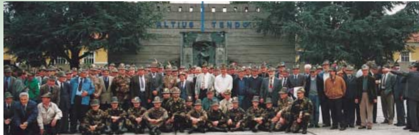
Foto di gruppo per i mortaisti della 133 a compagnia che sono tornati alla caserma Berardi di Pinerolo in occasione del loro undicesimo incontro.

Con loro erano i comandanti di allora, oggi generali, Michele Forneris e Giovanni Chiotasso.