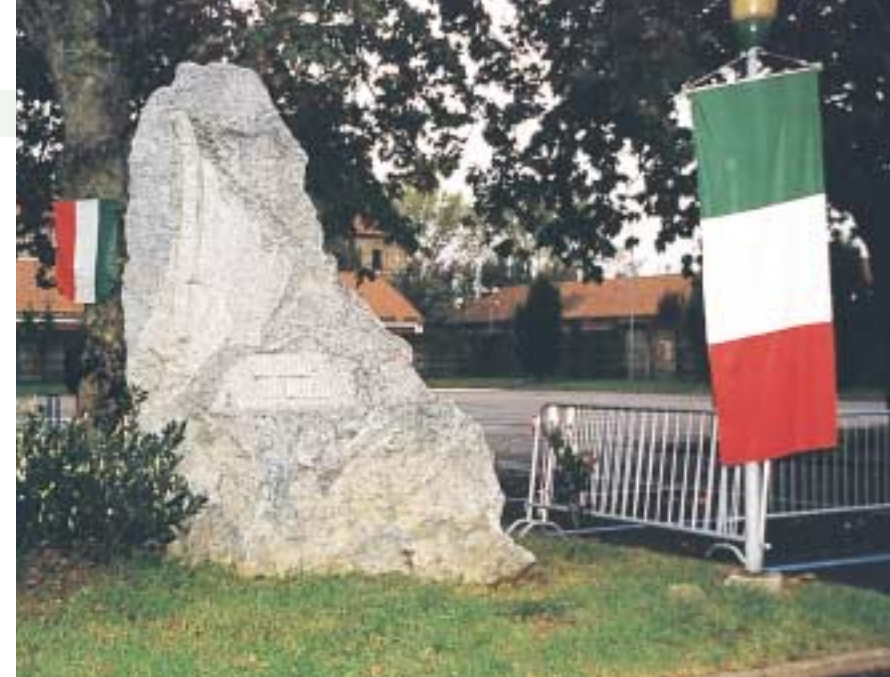
Cippo eretto nei pressi della sede e dedicato ai Caduti alpini della sezione.

Oggi è da tutti riconosciuto come il vero fondatore degli alpini, ideati da Ricci e Perrucchetti. Spirito eminentemente pratico (sua espressione ricorrente: "Lasciamo perdere gli aggettivi e usiamo i sostantivi"), aveva superato le difficoltà di bilan-