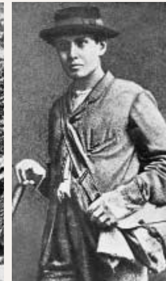
Edward Whymper, il venticinquenne conquistatore del Cervino.