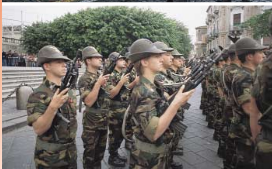
Nelle due compagnie del btg. "L'Aquila" del 9° Reggimento, ci sono anche una dozzina di caporal maggiori donna. Queste giovani hanno dimostra- to professionalità e carattere ed hanno suscitato – più che curio- sità – grande simpatia. La Bandiera di Guerra del 9°, scortata dal comandante col. Di Vita, e le due compagnie (che sono sempre state perfette) hanno riscosso lunghissimi applausi, come pure la Fanfara della Taurinense, congedatasi dalla sfilata suonando la sicilia- nissima "Ciuri, ciuri".