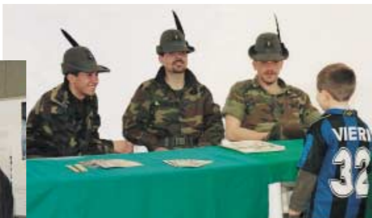
Al Vigorelli c'era anche uno stand delle Truppe alpine: qui vediamo la curiosità di un bambino davanti a tre "bocia".