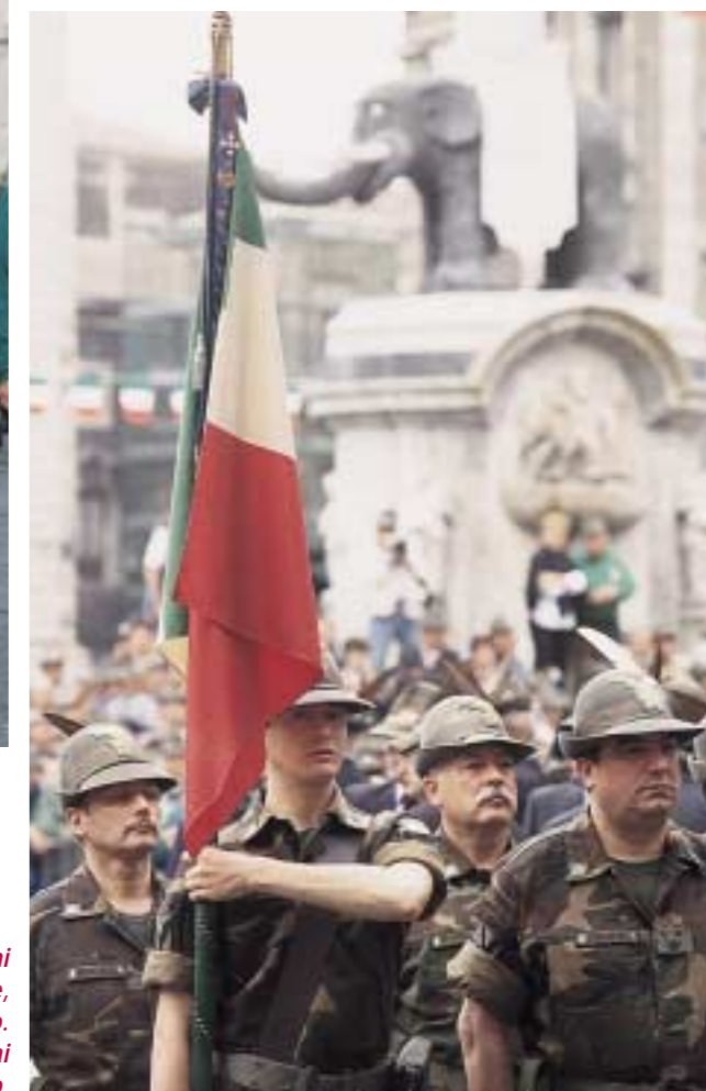
La Bandiera di Guerra del 9° reggimento Alpini con lo sfondo del monumento dell'Elefante, simbolo della città di Catania. Siamo in piazza Municipio. La sfilata è partita da piazza Verga, aperta proprio dai reparti alpini, così tanto acclamati per tutto il tragitto.