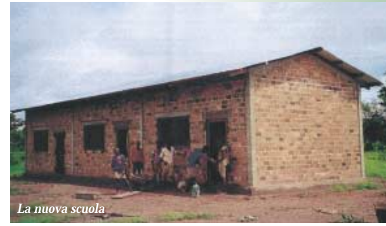
La nuova scuola

Il Paese purtroppo sta vivendo da cinque anni una