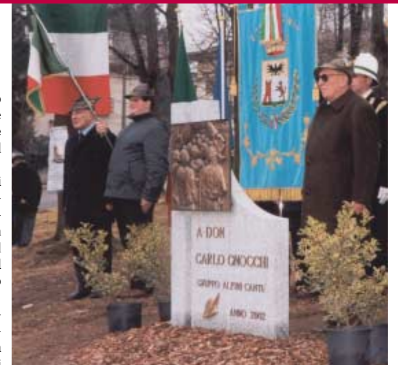
L'inaugurazione del cippo dedicato a don Carlo Gnocchi

Al termine dell'inaugurazione del cippo, realizzato su bozzetto del prof. Perini, è stata celebrata una S. Messa da mons. Bazzari e da mons. Gianni Fontana, cappellano del gruppo di Cantù.