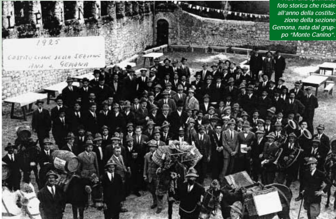
1925: una splendida foto storica che risale all'anno della costituzione della sezione Gemona, nata dal gruppo "Monte Canino".