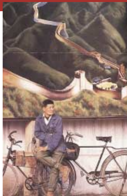
E' imminente l'assalto delle mountain-bike?

I dettagli sulla progettazione e l'esecuzione dell'opera sono frammentari e controversi. Eretta la coppia di muri, sia con pietre ricavate spaccando pazientemente le rocce, sia con mattoni fabbricati sul posto, lo spazio interno veniva riempito d'argilla, scaricata da lunghe corvées che sfilavano lentamente con due panieri a bilanciere sulle spalle. La terra veniva compressa con i piedi e rotolandovi