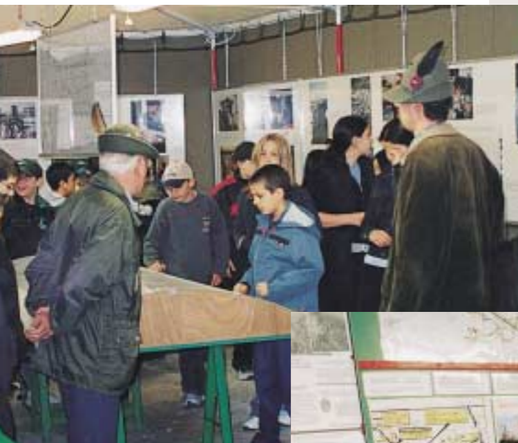
"Il reduce racconta...": è il titolo che questa bella foto suggerisce. Un "vecio" di Russia accompagna un ragazzo lungo gli stand della mostra sulla Protezione civile dell'ANA allestita al Vigorelli.