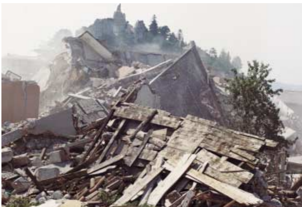
1976: ecco come fu ridotta Gemona dal terremoto del maggio 1976. Gli alpini furono tra i principali artefici della ricostruzione della città e del Friuli.