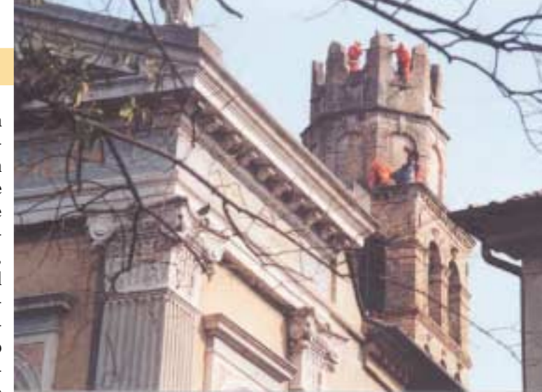
L'"assalto" al campanile di San Rocco, in centro a Conegliano

Dove passano, gli alpini lasciano sempre il segno. E di segni ne