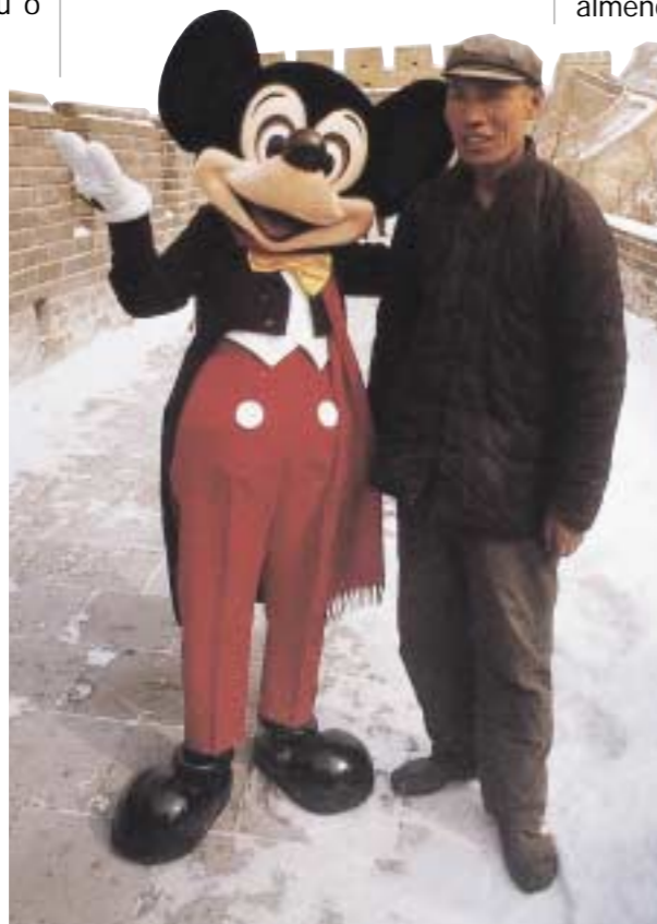
Sugli antichi camminamenti le favole di Disneyland s'incontrano col mito.