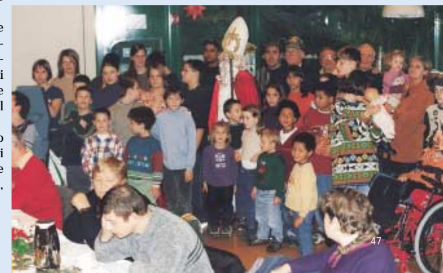
Gli alpini con i bambini dell'Istituto Lindenhof.