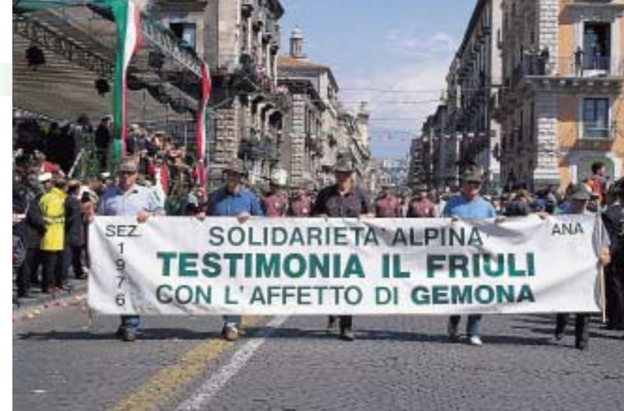
2002: la sezione sfila all'Adunata nazionale a Catania: tre lustri di storia alpina, tre lustri di storia d'Italia.

Il 1983 - è nella memoria di tutti - l'Adunata nazionale si svolse a Udine