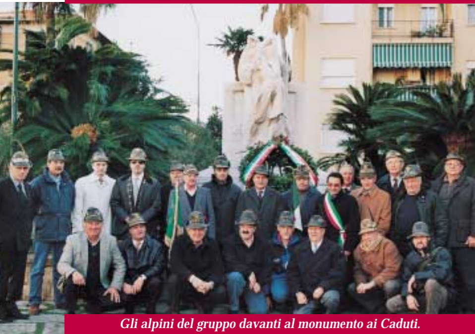
Gli alpini del gruppo davanti al monumento ai Caduti.